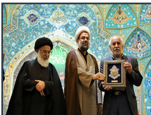
تجلیل از خانواده شهید عجمیان در حرم حضرت معصومه(س)