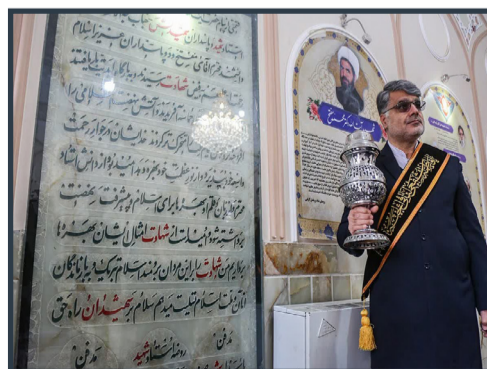
غبارروبی و عطرافشانی مزار شهید آیت الله مفتاح