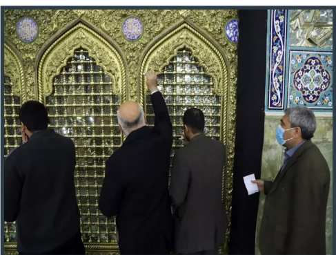
غبارروبی حرم حضرت معصومه(س) با حضور مسئولان دانشگاه های علوم پزشکی کشور