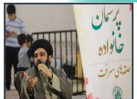
برگزاری ویژه برنامه «پرسمان خانواده» در حرم بانوی کرامت