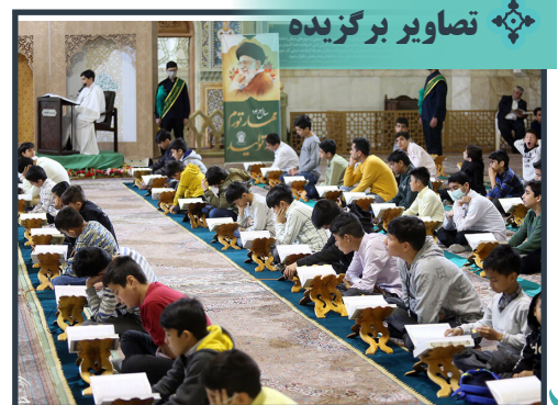
آیین ترتیل خوانی قرآن کریم ویژه نوجوانان