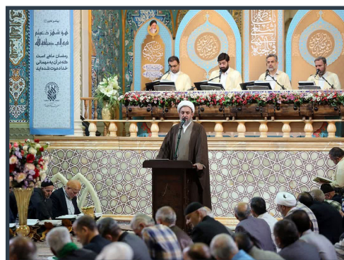
بیان نکات تفسیری در آیین بزرگ ترتیل خوانی قرآن کریم