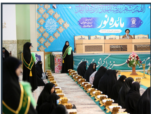
آیین ترتیل خوانی بانوان با سخنرانی آیت الله سعیدی

جعفری در ادامه با اشاره به فعالیت این واحد در بخش کودک نیز یادآور شد: میزبانی از مخاطبان در نمایشگاه رمضان هر روزه از ساعت ۲۰ تا ۲۴ در صحن پیامبر اعظم (ص) انجام می شود و تولید کلیپ های مجازی با عنوان ماجراهای آقا شادمان در ۱۵ قسمت در ماه مبارک با محوریت ارائه محتوای معارفی به کودکان فاطمی که در کانال کودکان فاطمی منتشر می شود از جمله فعالیت های این بخش است.