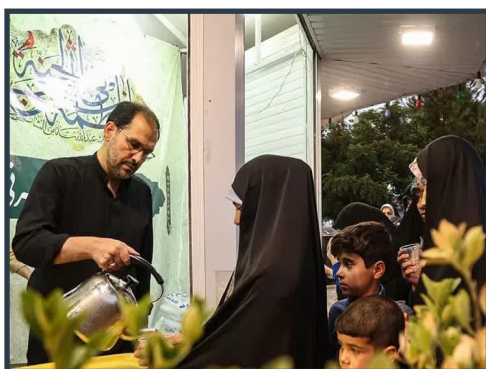
فعالیت چایخانه حضرتی از زائران و مجاوران بانوی کرامت