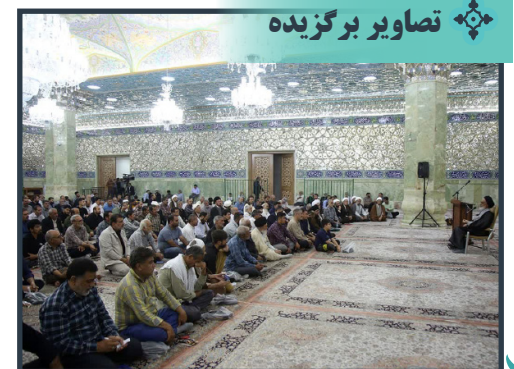
گردهمایی خدام هیأت‌های مذهبی در شبستان حضرت زهرا (س)