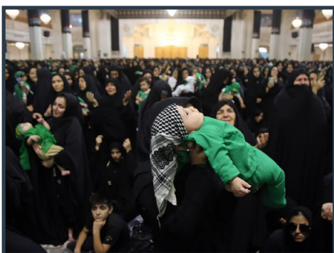
همایش شیرخوارگان حسینی در حرم حضرت معصومه (س) برگزار شد

همچنین برای ثبت نام در دوره‌های معارفی حضوری که همچنان امکان ثبت نام دارند می‌توانند به صورت حضوری به مرکز قرآن و حدیث مراجعه نمایند.