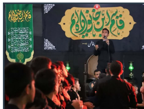
محفل عزای نوجوانان فاطمی با شعار «فاسم این خانواده‌ایم»