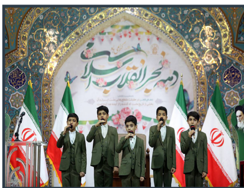
برپایی جشن های دهه فجر انقلاب در حرم مطهر بانوی کرامت