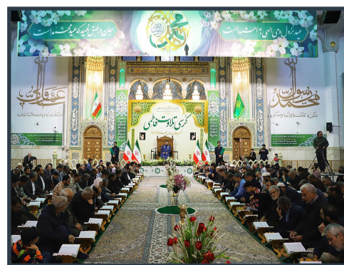
برپایی کرسی تلاوت فاطمی در جشن عید مبعث حرم مطهر بانوی کرامت