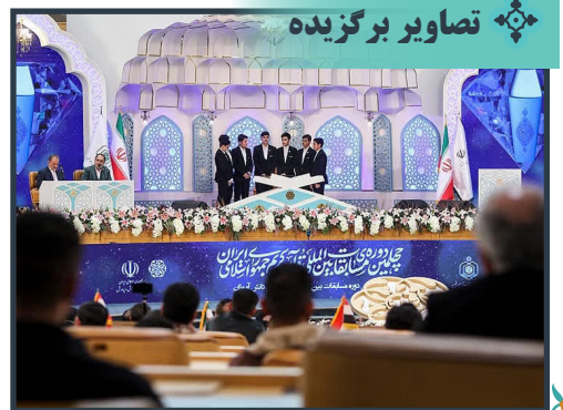
اجرای سفیران قرآنی کریمه در مسابقات قرآنی دانش‌آموزان جهان اسلام