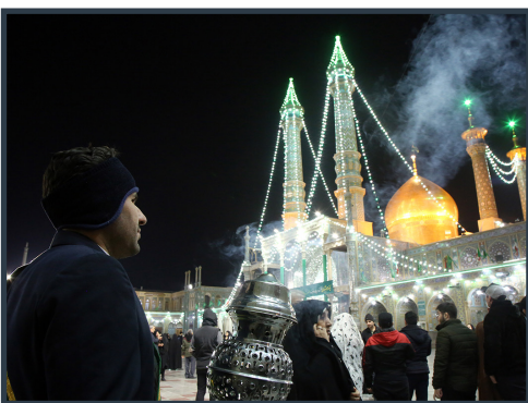
حال و هوای حرم مطهر در شب میلاد حضرت علی اکبر (علیه السلام)