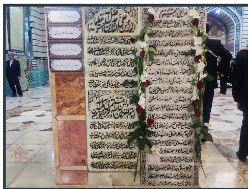
مراسم بزرگداشت شهید محلاتی در حرم مطهر بانوی کرامت