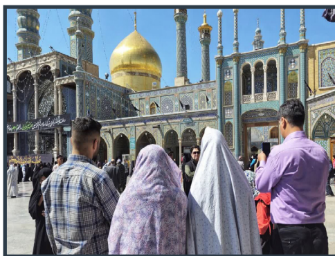
حضور زائران نوروزی در حرم مطهر بانوی کرامت