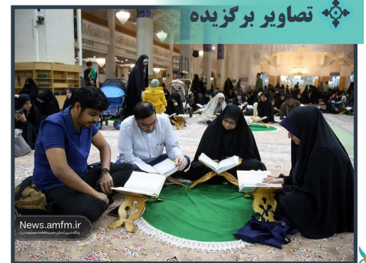
آیین ترتیل خوانی خوادگی در حرم مطهر بانوی کرامت