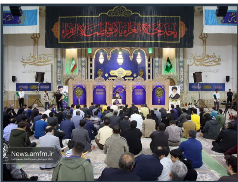
مراسم عزاداری وفات حضرت خدیجه‌سرازه (علیها السلام) در حرم حضرت معصومه‌سرازه (علیها السلام)

اضافه بر این کانال معصومانه پاتوق مجازی دختران نوجوان و مربیان دغدغه‌مند است که با عضویت در این کانال به آدرس masumaneh@ می‌توانند از برنامه‌های فرهنگی خواهران به صورت مجازی و غیر حضوری بهره‌مند شوند. همچنین علاقه‌مندان برای کسب اطلاعات بیشتر در مورد برنامه‌های رواق معصومانه می‌توانند با شماره ۰۲۵۳۷۱۷۵۵۳۸ تماس گرفته و با کارشناسان امور فرهنگی خواهران در رواق معصومانه در ارتباط باشند.