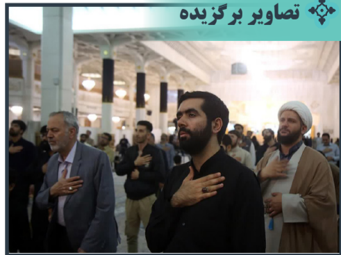
مراسم عزاداری شهادت حضرت حمزه (ع) در حرم بانوی کرامت