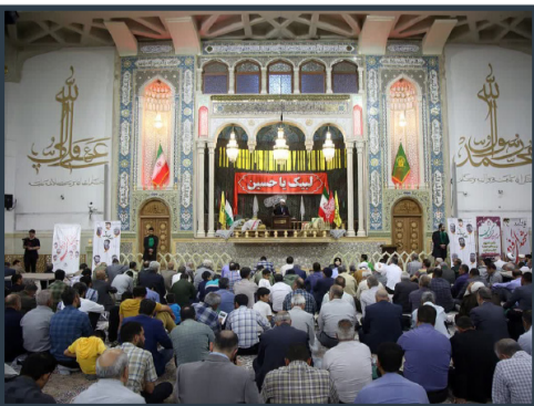
یادواره شهدای روستای فردو در حرم حضرت معصومه سلام الله علیها

فرمانده انتظامی کشور ضمن تأکید بر آثار حمایت همگانی مردم از طرح نور، خاطر نشان کرد: هیچ اراده، تهمت، سرزنش و شماتتی نمی تواند ما را از این راه پرفیضی که حضرت حق در برابر ما قرار داده عقب بکشاند.