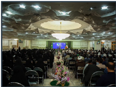
آیین شکرانه خدمت در حرم حضرت معصومه سلام الله علیها