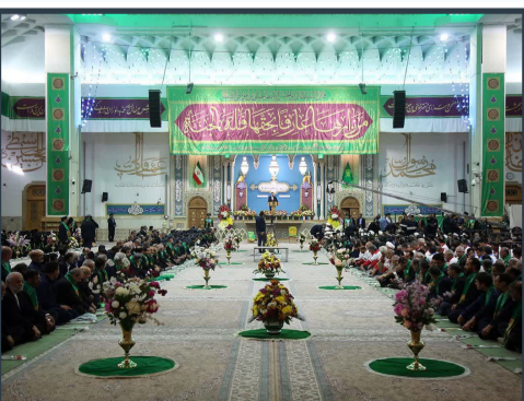
آیین خطبه خوانی آغاز جشن های دهه کرامت در حرم مطهر قم

وی گفت: محتوای بکار رفته در این درب اسامی مبارک چهارده معصوم (ع) و فرازی از زیارت حضرت معصومه (س) بوده و در قسمت فوقانی فرازهایی از آیات قرآن کریم اجرا و نصب شده است.