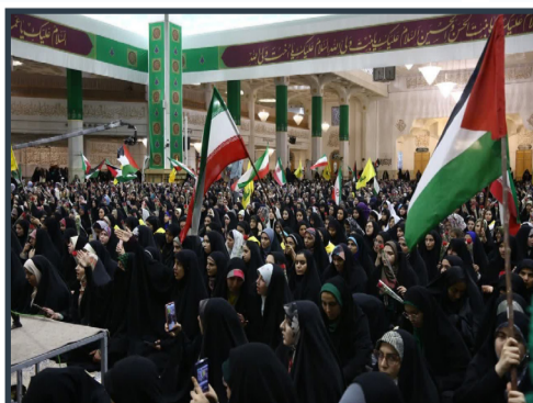
اجتماع بزرگ دختران دانشجو در حرم مطهر حضرت معصومه سلام الله علیها