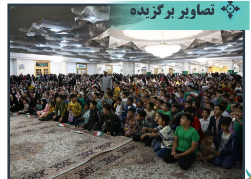
جشن بزرگ «خواهربرادری» در حرم مطهر بانوی کرامت