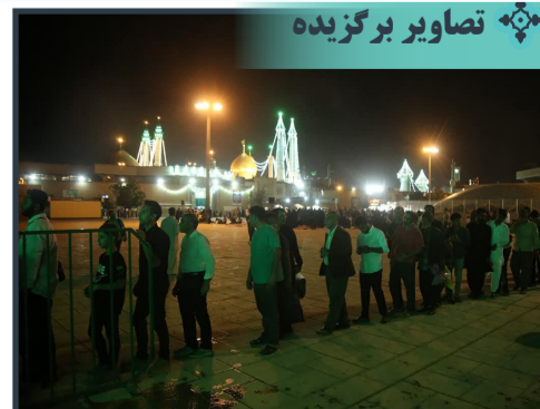
فعالیت ایستگاه های صلواتی عید غدیر در حرم مطهر بانوی کرامت