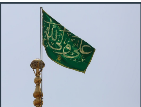
اهتزاز پرچم سبز «علی ولی الله» بر فراز گنبد مطهر حرم بانوی کرامت

در پایان این نشست، با حضور معاون فرهنگی آستان مقدس حضرت فاطمه معصومه سلام الله علیها از حجت الاسلام محمدباقر انصاری و ناقدان حاضر در این نشست تقدیر شد.