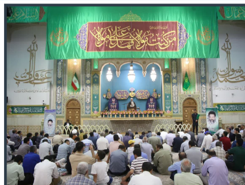
جشن میلاد امام کاظم (ع) و بزرگداشت شهدای خدمت و شهدای هفتم تیر