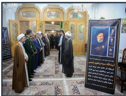
بزرگداشت چهلین روز شهادت شهدای خدمت در حرم حضرت معصومه سلام الله علیها