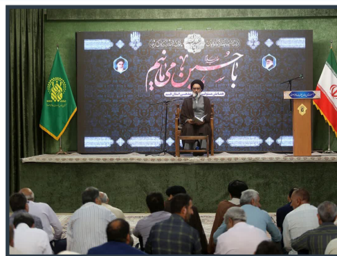
همایش مسئولان هیئات مذهبی استان قم در حرم مطهر بانوی کرامت