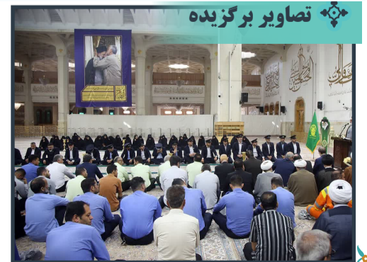
آیین سیاه‌پوشی حرم مطهر بانوی کرامت در آستانه آغاز ماه محرم