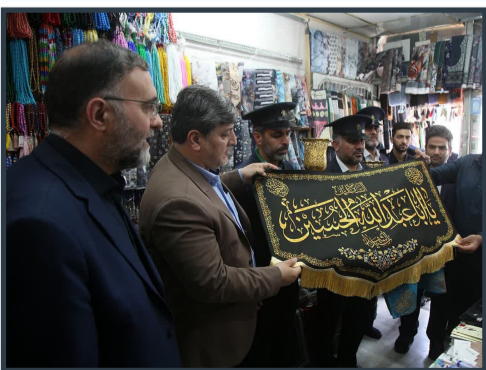
اهدای پرچم عزای سیدالشهدا (ع) در به کسبه اطراف حرم مطهر بانوی کرامت

وی با بیان اینکه باید فردی را انتخاب کنیم که نسبت به عملکرد رئیس‌جمهور قبلی متعهد باشد و دوره ریاست‌جمهوری قبل را تمام شده تلقی نکند، افزود: نباید یک جریان که روی کار می‌آید هر چه جریان قبلی انجام داده را نادیده بگیرد و یا خراب کند؛ زیرا این کار به ضرر مردم است و بیشترین آسیب به مردم می‌رسد.