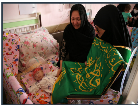
سفیران کریمه در ششمین روز ماه محرم به عیادت کودکان بیمار رفتند