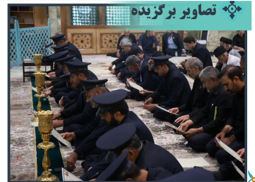
آیین خطبه‌خوانی و قرائت زیارت عاشورای خادمان حرم مطهر بانوی کرامت