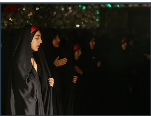
برپایی محفل عزاداری دختران بهشتی در حرم مطهر بانوی کرامت

وی افزود: تمامی مشاوره‌های ارائه شده در حرم مطهر حضرت معصومه سلام الله علیها به صورت رایگان انجام می‌شود و اگر چنانچه فردی نیاز به مشاوره‌های تخصصی تر و یا روانپزشک را داشته باشد راهنمایی‌های لازم صورت می‌گیرد.