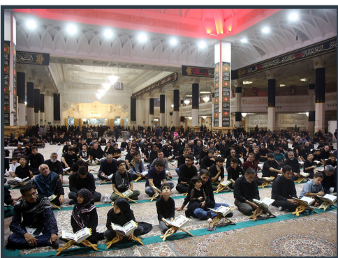
مراسم احیای شب عاشورا در حرم حضرت معصومه سلام الله علیها

مؤمنی قدم آخر برای سیر و سلوک در دستگاه امام حسین علیه السلام را از بین رفتن حجاب ها بین ما و ابا عبدالله الحسین علیه السلام دانست و گفت: اگر حجاب ها از بین برود انسان به مقام قرب امام زمان (عج) می رسد.