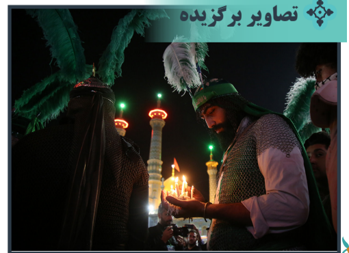
حال و هوای مراسم شام غریبان اسرای کربلا در حرم مطهر بانوی کرامت