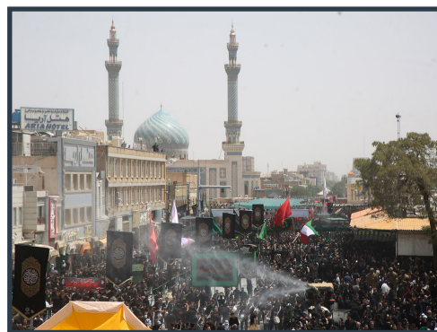
شور دسته جات عزاداری روز عاشورا در حرم مطهر بانوی کرامت