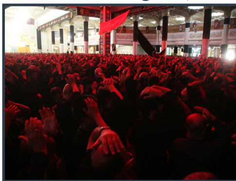
مراسم مقتل خوانی ظهر عاشورا در حرم مطهر بانوی کرامت