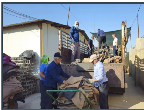
تلاش خادمان موكب عمود ۱۰۸۰ برای میزبانی از زائران اربعین حسینی