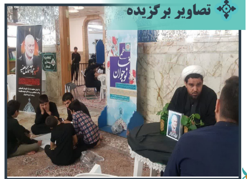
گفتگوی صمیمی کارشناسان با نوجوانان فاطمی در یک فنجان نوجوانی