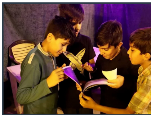
برپایی موكب «قهرمان هفتاد و سوم» در حرم مطهر بانوی کرامت