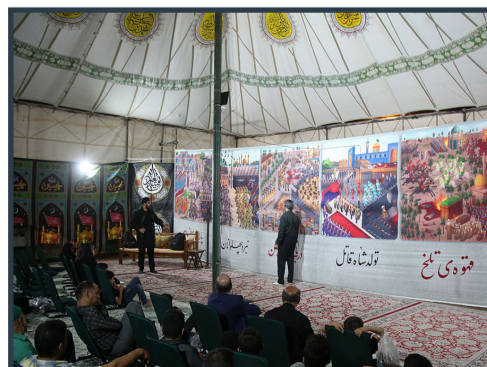
اجرای پردهخوانی نمایشی «رتج شیعہ» در حرم مطهر بانوی کرامت