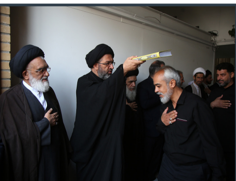
آئین بدرقه خادمان موکب حرم مطهر بانوی کرامت برگزار شد

وی برگزاری محافل قرآنی را از دیگر برنامه های فرهنگی موکب دانست و ابراز داشت: برنامه های قرآنی خوبی هم در بخش بانوان و هم در بخش آقایان تدارک دیده شده تا زائرین گرمی از فیض وجودی قرآن کریم در این سفر معنوی بیش از پیش بهره مند شوند.