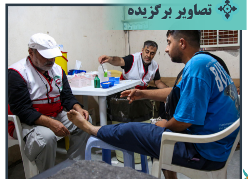
ارائه خدمات بهداشتی و درمانی در موکب حرم حضرت معصومه سلام الله علیها در عراق