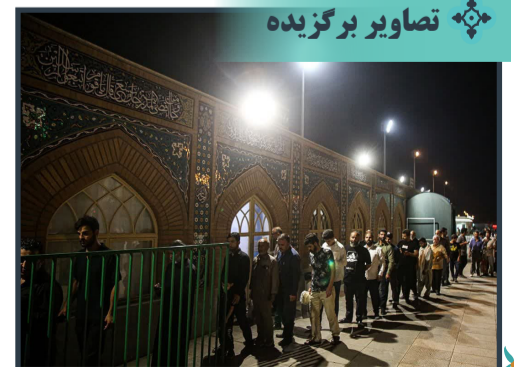
پذیرایی موبک‌های مستقر در حرم حضرت معصومه سلام الله علیها از زائران اربعین حسینی