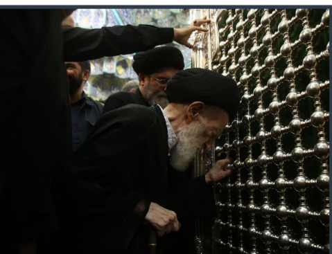
تشریف آیت الله شبیری زنجانی به زیارت حرم حضرت معصومه سلام الله علیها

مسئول مهمانسرای موبک آستان مقدس کریمه اهل بیت سلام الله علیها در پایان سخنان خود از رعایت دقیق نکات بهداشتی از سوی پرسنل آشپزخانه و ناوایی موبک گفت و تأکید کرد: کلیه پرسنل و همکارانی که در این بخش فعالیت می‌کنند همگی در ایران کارت بهداشت دارند و کلیه نکاتی که مربوط به بهداشت کارکنان و محیط می‌شود را رعایت می‌کنند.