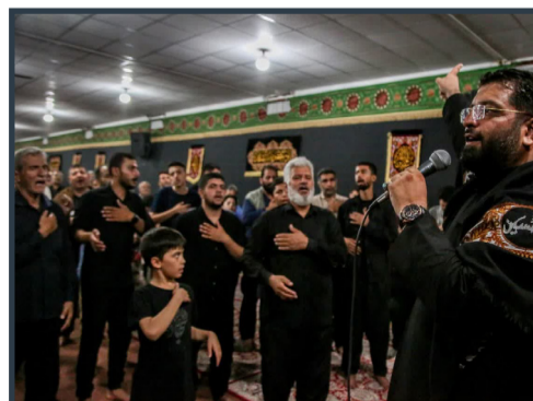
عزاداری شب دوازدهم صفر در موبک حرم حضرت معصومه سلام الله علیها