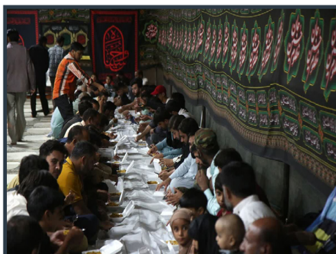
خدمت‌رسانی به زائران پاکستانی در حرم مطهر حضرت معصومه سلام الله علیها