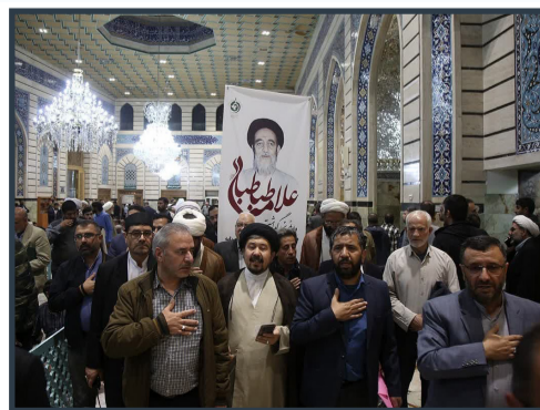
بزرگداشت علاقه طباطبایی در حرم مطهر بانوی کرامت