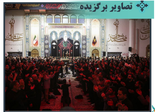
محل عزاداری شام شهادت حضرت زهرا سلام الله علیها در حرم مطهر