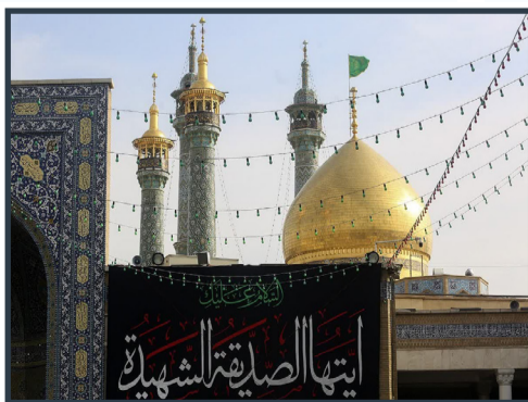
سیاهپوشی حرم حضرت معصومه سلام الله علیها به مناسبت ایام فاطمیه