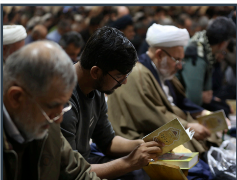
فرات های ام داوود در حرم حضرت معصومه (س)

وی با اشاره به محوریت حرم حضرت زینب سلام الله علیها در جریان دفاع از حرم و حریم اهل بیت سلام الله علیها و افرادی که در این راه به شهادت رسیدند و یا جانباز و ایثارگر شدند، گفت: دلیل دیگر برای نام گذاری این شبستان به این نام، ادای احترام و تجلیل از مقام شامخ همه مدافعان حرم به ویژه سردار سلیمانی است که سال ها برای دفاع از حرم تلاش و مجاهدت کردند و تکریم خانواده های آنها که در این سال ها با صبر و مقاومت خود از این راه حمایت کردند گفتنی است شبستان حضرت زینب سلام الله علیها نزدیک به ۸ هزار مترمربع فضای مسقف دارد که ظرفیت آن برای اقامه نماز، ۷ هزار نفر و برای اجرای مراسم، ۱۰ هزار نفر است. با هدف بهره برداری معنوی و زمینه سازی برای خدمت بیشتر به زائران ساخته شده است و تا قبل از آغاز سال جدید افتتاح خواهد شد.