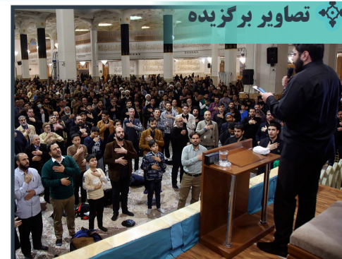
محفل عزای عقیده بنی هاشم در حرم کریمه اهل بیت سلام الله علیها