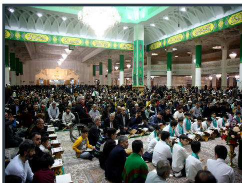
برپایی کرسی تلاوت فاطمی در جشن شام میلاد امیرالمؤمنین علیه السلام