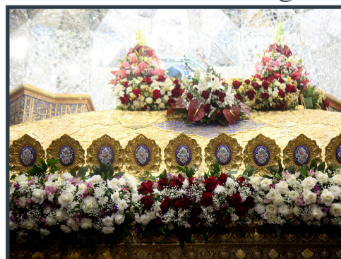
گل آرایی ضريح حضرت معصومه سلام الله علیها به مناسبت میلاد امام جواد علیه السلام